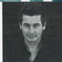
Unverwechselbar auch auf der Bühne: Der Schweizer Autor Arno Camenisch.

Kantonsbibliothek Baselland Sind wiederum Dichter:innen und Stadtmuseum Liestal präsentieren: Literatur Open Air Liestal 3.9.2022, ab 18.30 Uhr, Zeughausplatz Liestal, kbl.ch